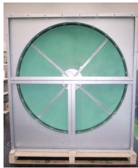
マルチモードローター