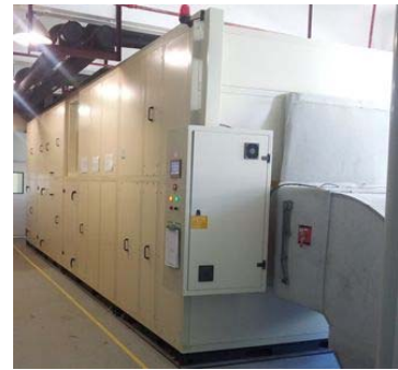
マルチモード空調機（イメージ）